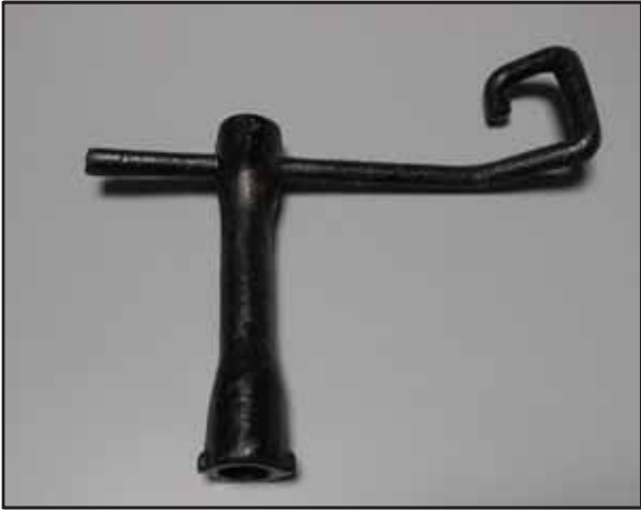
Chiave per Apertura Chiusini Triangolari