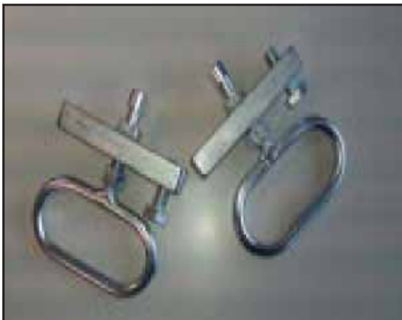
Coppia di Estrattori di chiusino